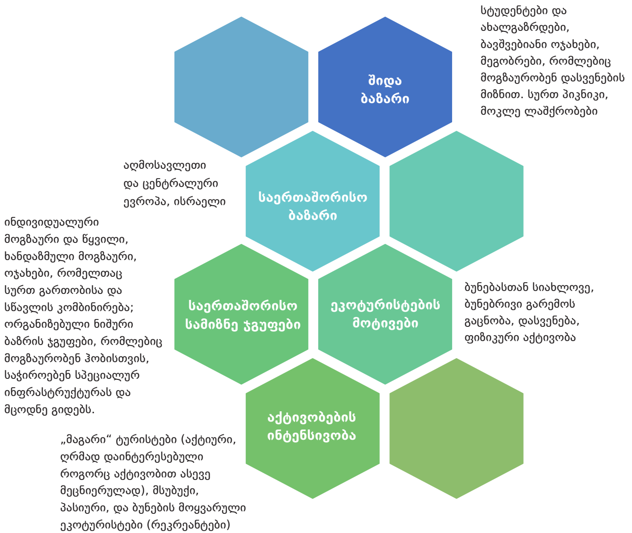
სქემა 2. ეკოტურისტების სხვადასხვა სეგმენტი საქართველოში